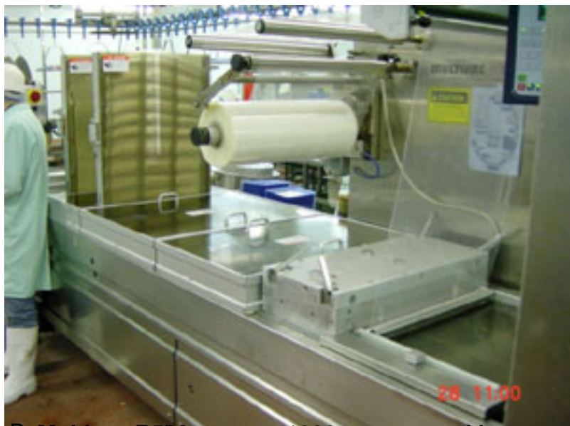
Вакуумная вертикальная упаковочная машина. Максимальная ширина формы 400 мм, скорость до 1000 шт/мин.