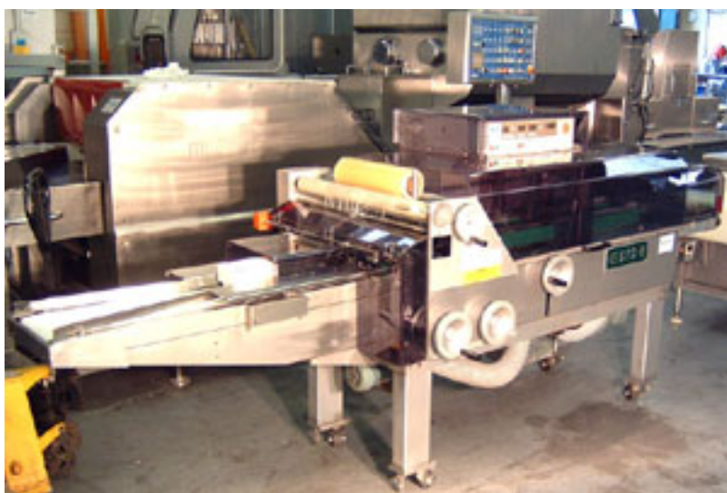
Горизонтальные упаковочные автоматы для упаковки лотков с продуктами в стретч-пленку