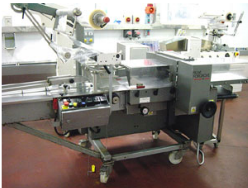
Rose Forgrove Flowpack 100.