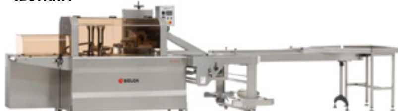
Термосалонный тоннель BTVD-45/25-INOX